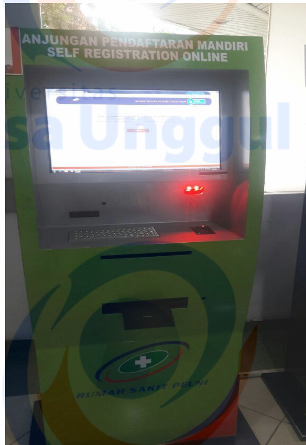
Contoh Bukti Registrasi Online